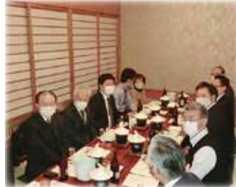
挨拶はそのぐらいで