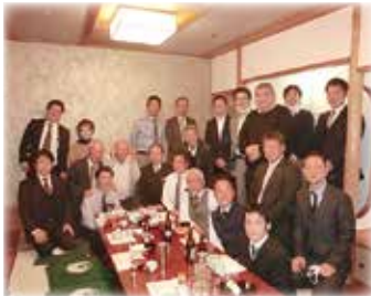
コロナに負けるな