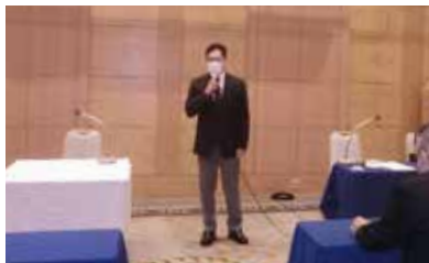
中川会長あいさつ